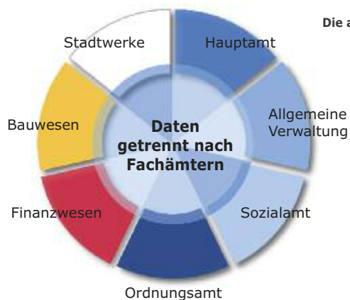
Die aktuelle Organisationsstruktur des internen Ämter-Netzwerks

Zudem sind die Daten historisch bedingt über alle Fachämter und deren spezifische Fachverfahren verteilt. Wer sich erst mit der Beschaffung von Daten und Informationen befassen muss, dem fehlt die Zeit für das Wesentliche.